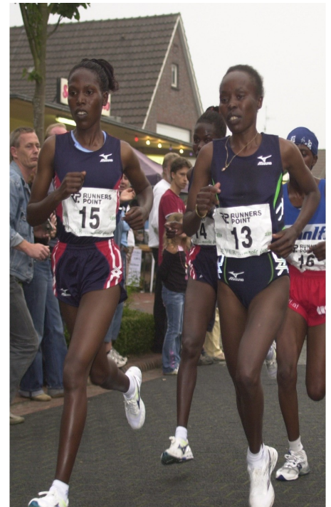
Leichtfüßig schweben die kenianischen Läufer und Läuferinnen über die Laufstrecke

Auch Breitensportler kommen hier voll auf ihre Kosten: Einsteiger, Familien und Kinder sind herzlich willkommen, um Teil dieses sportlichen Highlights zu werden. Der Jever-Fun-Lauf ist weit mehr als ein Wettkampf – er ist ein Fest für die ganze Region, das Menschen zusammenbringt und begeistert.